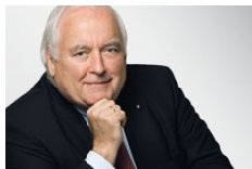
Friedrich G. Conzen Bürgermeister

Zahlreiche prominente Lesefreudige unterstützen uns: