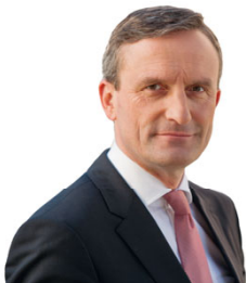
Schirmherr des Lesefestes Thomas Geisel Oberbürgermeister der Landeshauptstadt Düsseldorf

Zahlreiche prominente Lesefreudige unterstützen uns: